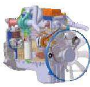
DL08 – EURO III / TIER III