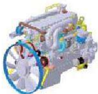
DL06 – EURO III / TIER III

Все, что Вам необходимо для решения Ваших энергетических потребностей, Вы можете найти у нас, выбирая промышленный или автомобильный двигатель для своего бизнеса. Товарный знак Doosan в сочетании с двигателями серий DL06, DL08, DL11 гарантирует выполнение работы независимо от ее сложности. Аккумуляторная топливная система высокого давления дизельных двигателей (ATC) или система впрыска топлива с общей топливной рампой, полностью управляемая электроникой, соответствует жестким стандартам EURO-3 и TIER-3 по допустимому выбросу отработанных выхлопных газов в окружающую среду и обеспечивает более высокую мощность плюс усиленные эксплуатационные качества. Диапазон мощности предлагаемых двигателей от 147 кВт до 309 кВт. Двигатели производства фирмы Doosan разработаны и изготовлены только для Вас.