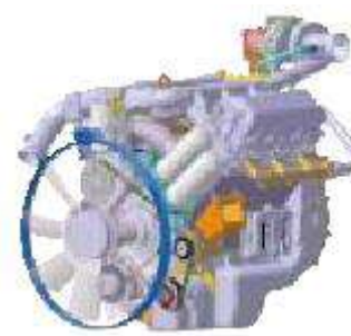
DV11 – EURO III / TIER III